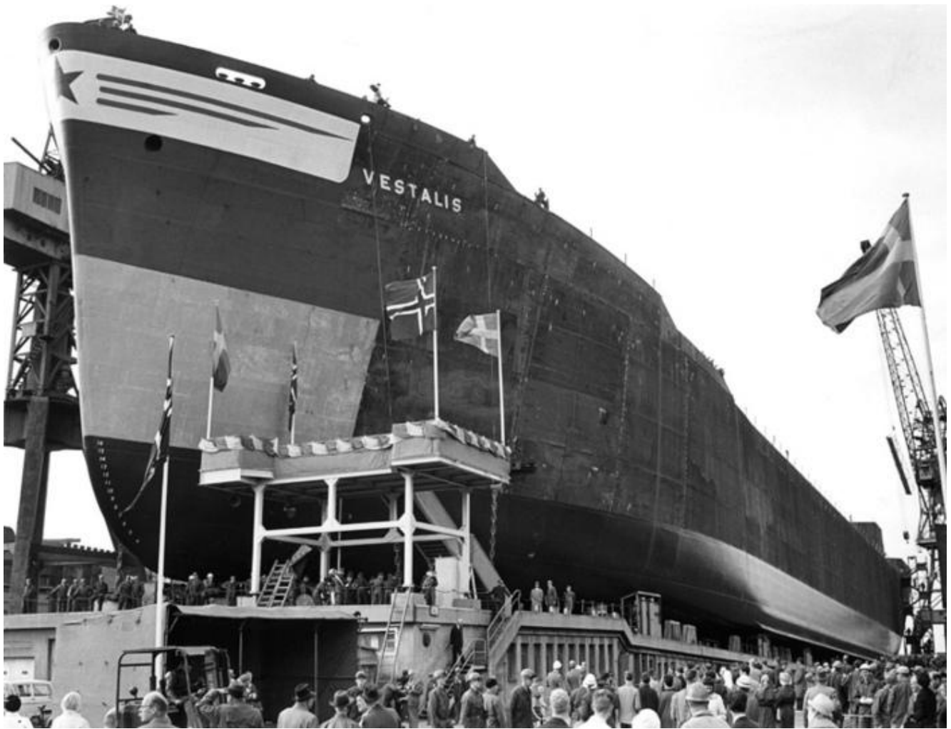
Motortankern Vestalis, bnr 458, levererad 1963.