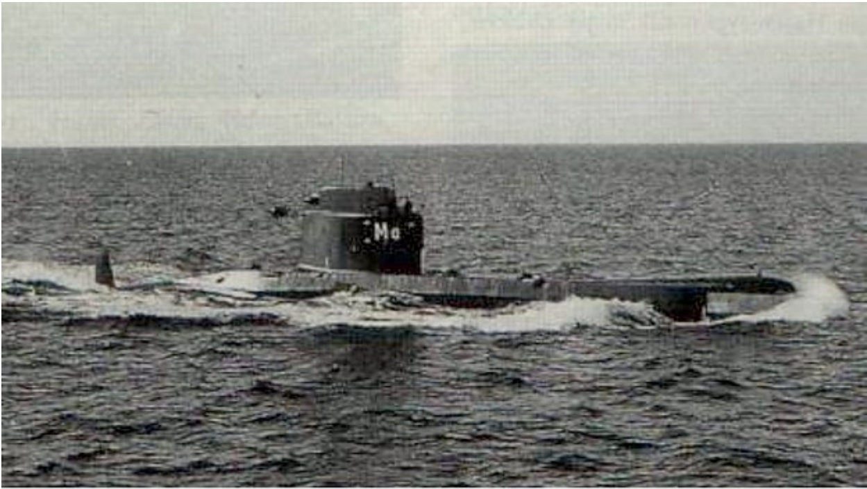
Ubåten Makrillen ombyggd U7 i Karlskrona 1963. displacement 388 ton.

Ubåten Makrillen ombyggd U7 i Karlskrona 1963. Displacement 388 ton.