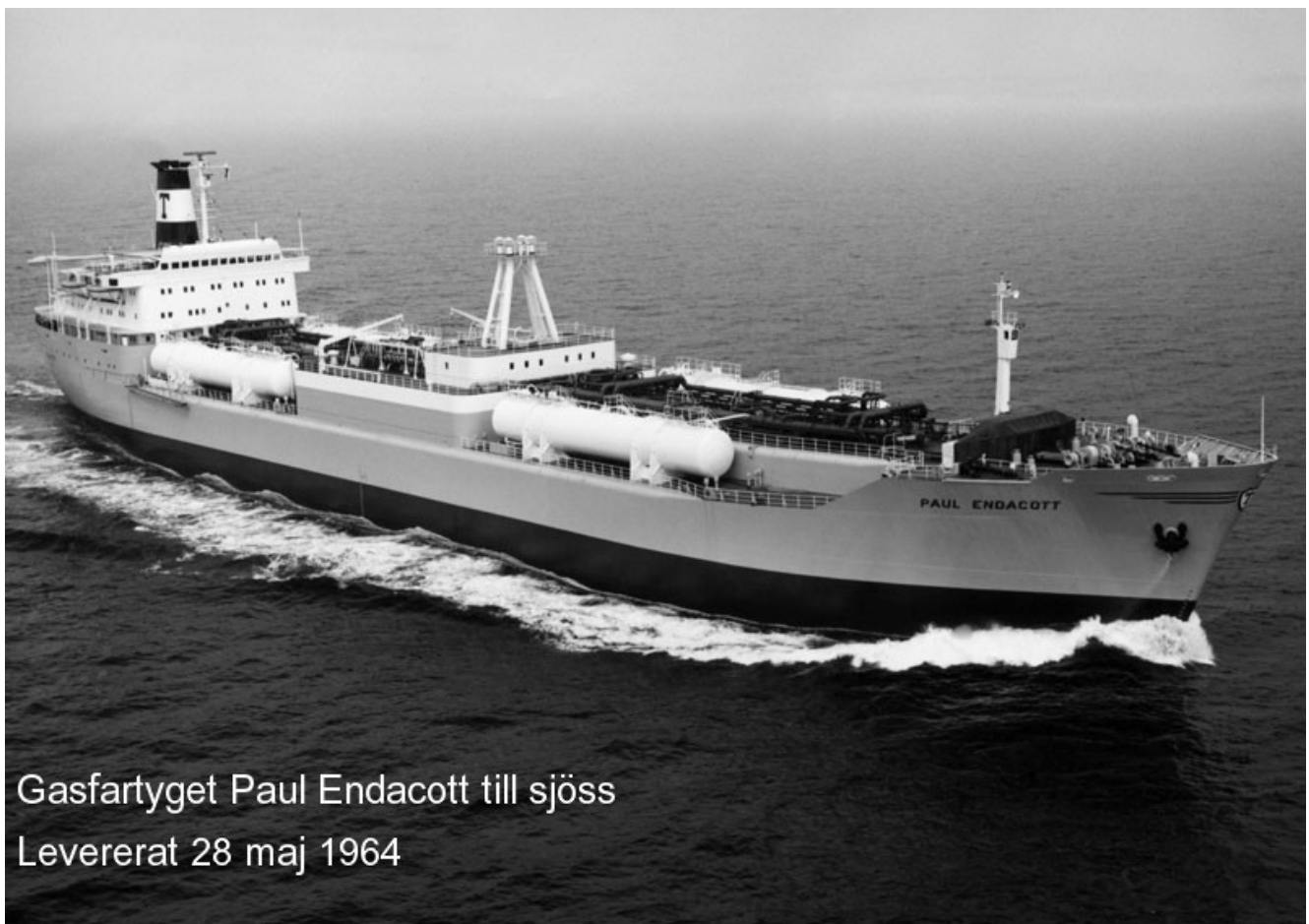
Gasfartyget Paul Endacott till sjöss Levererat 28 maj 1964

Gasfartyget Paul Endacott till sjöss. Levererat 28 maj 1964.