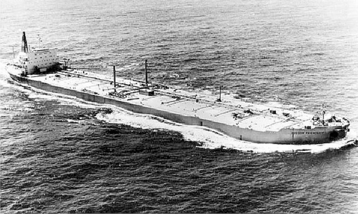
Auke Visser's International Super Tankers - Photo Dag Bjelke

Auke Visser's International Super Tankers – Photo Dag Bjelke.