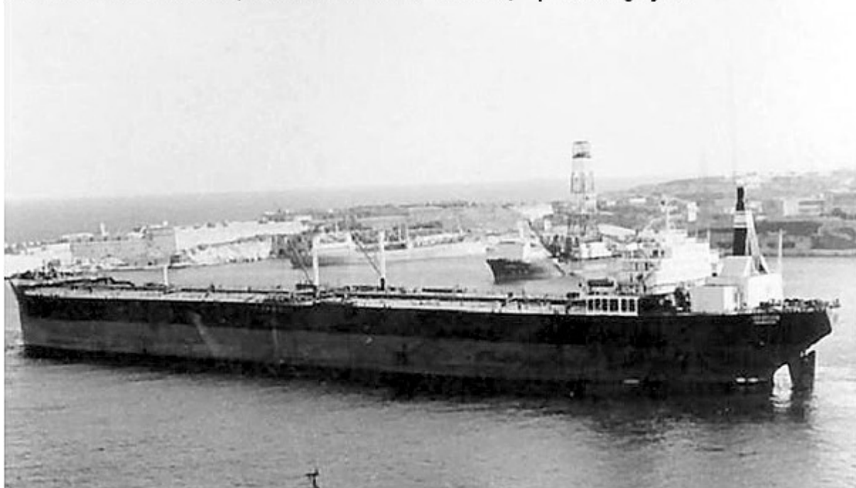
B.nr 526 Hudson Venture (here with new name Gratian ) – photo Dag Bjelke.

Fler bilder, från bildarkivet Kockums Mekaniska Verkstads AB: