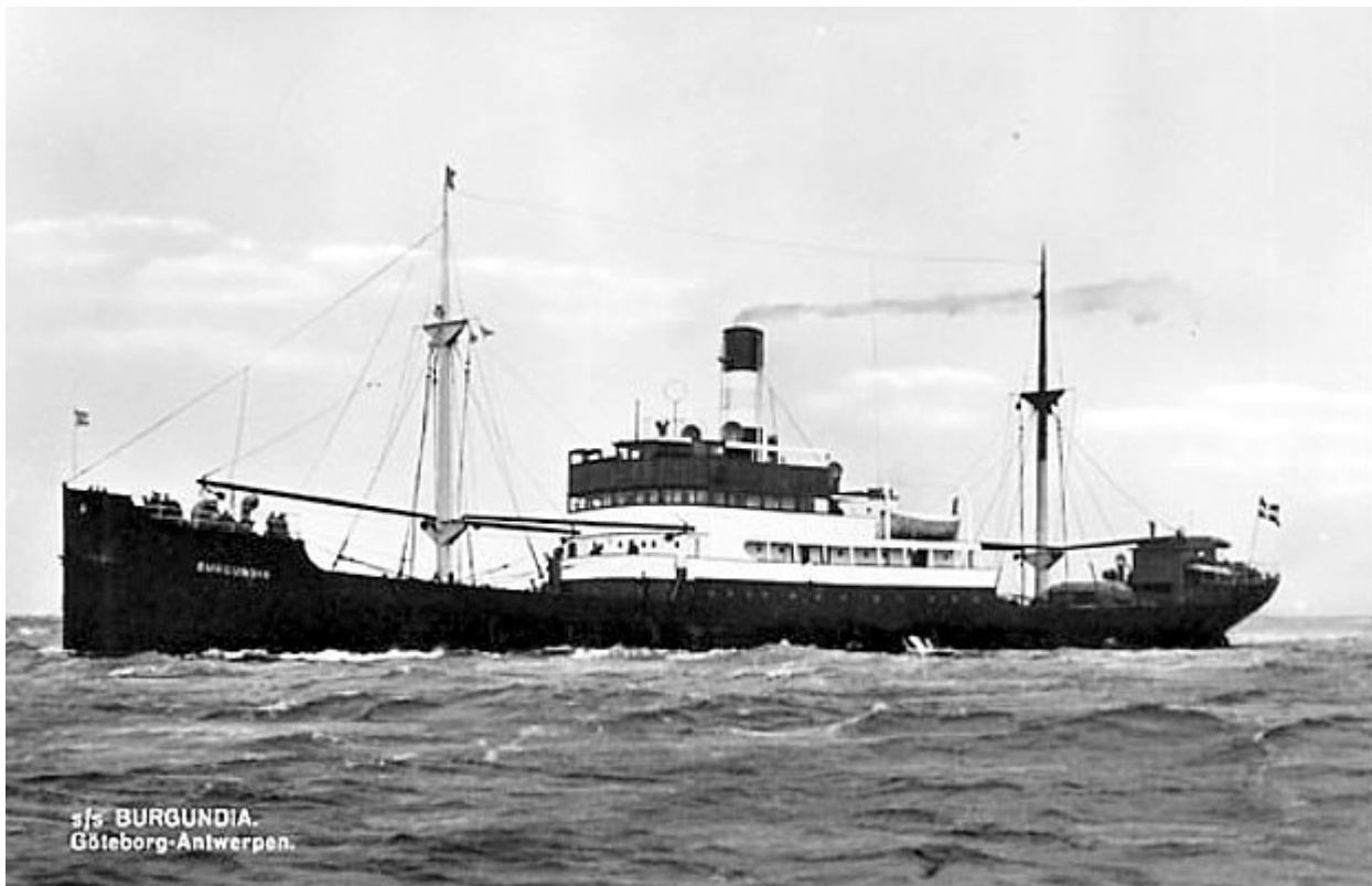
S/S Burgundia. Göteborg – Antwerpen.