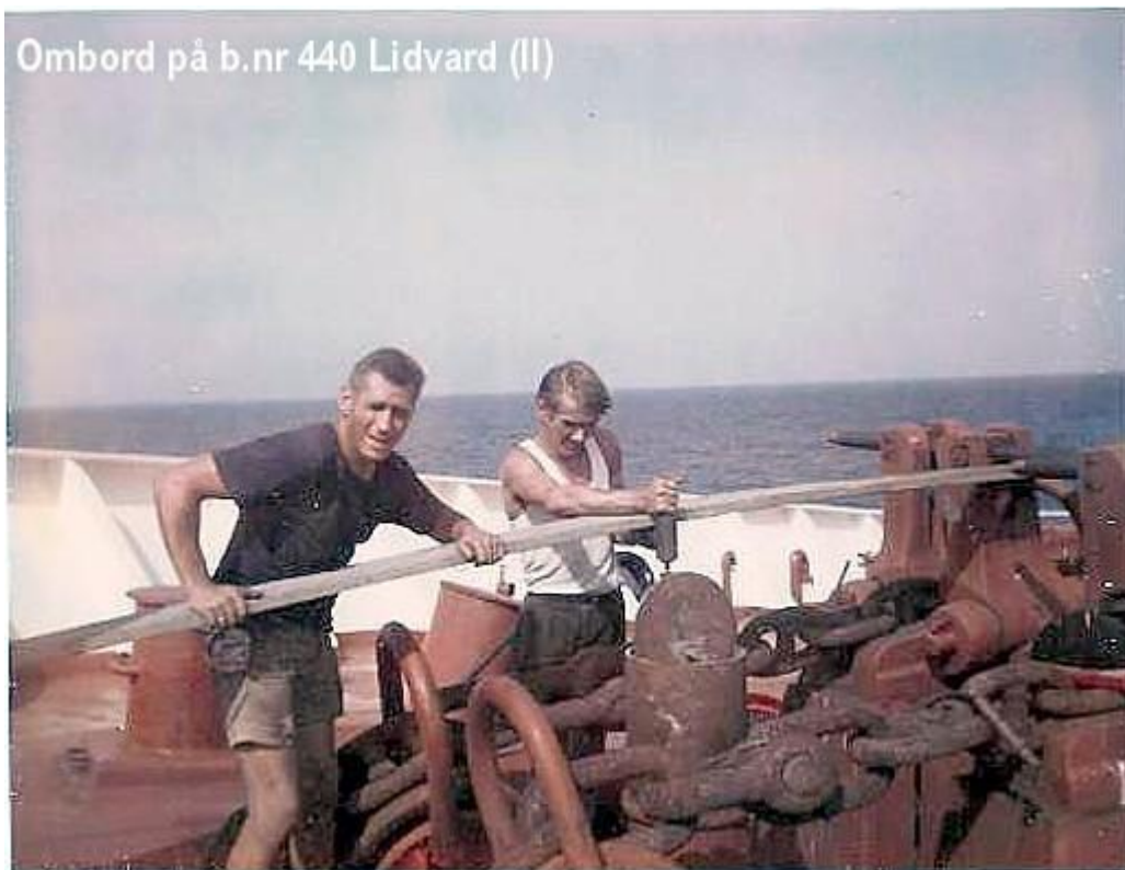
Ombord på b.nr 440 Lidvard (II)

Var Motormann ombord her fra høst 1967 – høst 1969 Fin båt . Kocums Man har jeg skrudd en del på , fin motor.