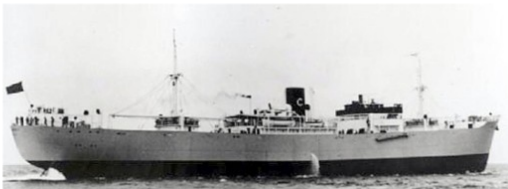
Fartyget blev torpederat. T.V bild tagen från annan livbåt Fotot taget med vanlig gammal lådkamera